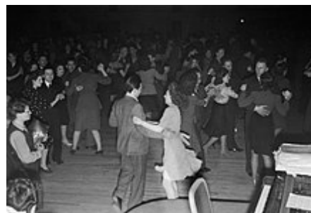
Jiving en un salón de baile británico, 1945.