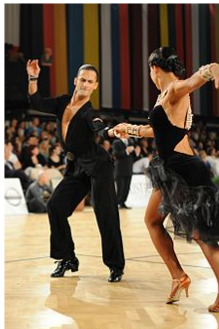
Campeonato Abierto de Austria Viena, 2012 Campeonato Mundial de Baile Deportivo de WDSF Latin 16.-18. Noviembre de 2012.

Después de la guerra, el boogie se convirtió en la forma dominante de la música popular. Sin embargo, nunca estuvo lejos de la crítica como una danza extranjera y vulgar. El famoso gurú de baile de salón, Alex Moore, dijo que «nunca había visto nada más feo». En 1968 fue adoptado como el quinto baile latino en competiciones internacionales. La forma moderna de baile de salón en la década de 1990 al presente, es una danza muy feliz y rápida, la elevación de las rodillas y la flexión o el balanceo de las caderas a menudo se produce.